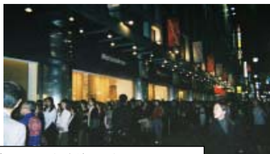
昨年10月に銀座地区で行なったときの様子。1万800人の集客