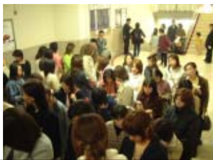
4月に行なわれた大阪イベントの様子。3日で1万人集客