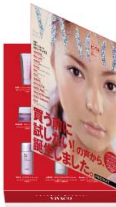
（見本誌イメージ）コスメサンプル がついた新しい形のメディアです。