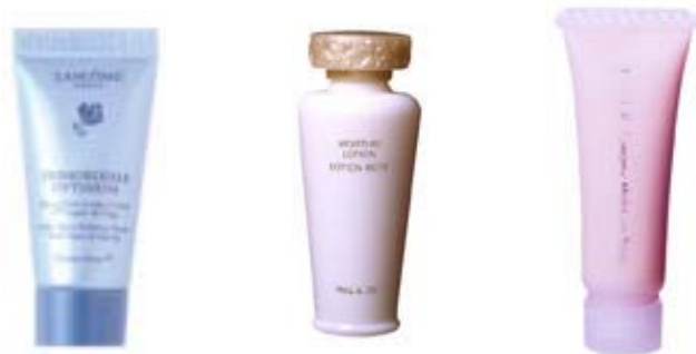
↑添付サンプルの例(それぞれ、実寸とは異なります)

ほかMAX FACTOR、LOREAL PARIS、DOLCE & GABBANA、KOSEの全12ブランド・商品