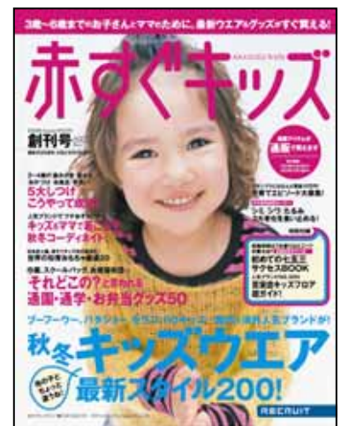
赤すぐキッズ創刊号表紙