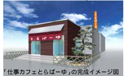
「仕事カフェとらばーゆ」の完成イメージ図

番台セミナー:有識者ゲストが「番台」で、「仕事との付き合い方」などをトーク(毎週金曜日) 職種紹介イベント:「旬の職種」など様々な仕事のやりがいを先輩がレクチャー(毎週火・木曜日) 転職応援セミナー:面接ファッションショー、フリーター卒業応援講座、子育てママの再就職講座 ほか(毎週土曜日) 採用イベント:話題企業の採用説明会、新商品の企画提案オーディション ほか(毎週月曜日) オリジナル適職診断テストコーナー:通常2000円の適職診断テストを無料で受験可能(常時) キャリアカウンセリングコーナー:6人1組でカウンセラーのナビゲーションのもとグループ ワークを実施(毎週水曜日・土曜日) ヘアメイク付き履歴書用写真撮影サービス(毎週水曜日) この他、日替わりで昼間と夜間にそれぞれユニークなイベントや講座を実施予定。