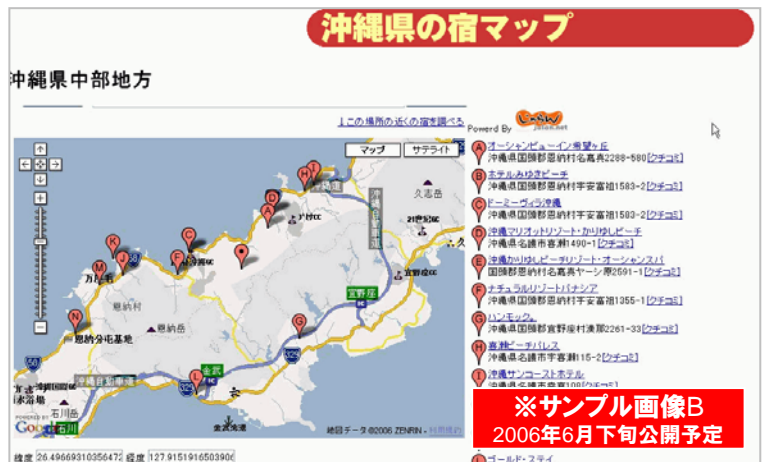
※サンプル画像B 2006年6月下旬公開予定

また、県別、エリア別の宿泊施設地図をGoogleMap上に表示する。(サンプル画像B) (宿泊施設情報はじゃらん宿表示APIを利用して取得。) 気になる宿・ホテルが見つかったら、そのままじゃらんnetの詳細ページに進むことができ、空き部屋確認～予約などが行える。