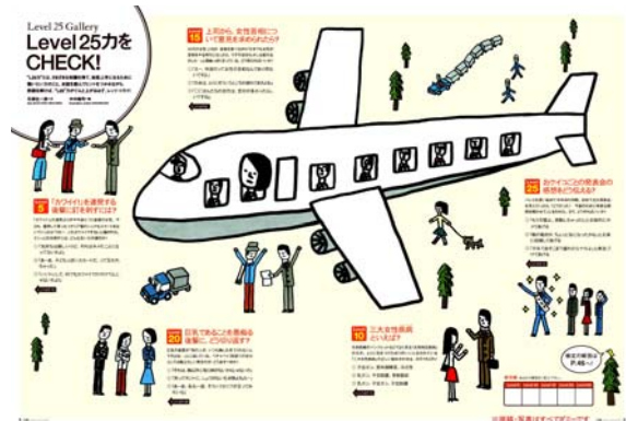
L25検定ページイメージ

毎号、全体で扱っている話題を既に知っているかチェックできる「L25検定」を設置。大人のバランス力を「L25力」として、「大人力」「女子力」「自分力」という3要素を設定。それぞれのテーマに対応する連載も予定しています。「自分力」をテーマとした連載では、毎号テーマを設けて本を紹介する「BOOKレビュー」ページを予定しています。