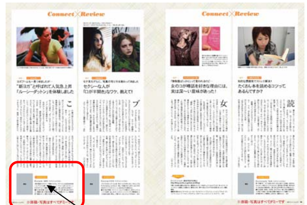
雑誌・番組を紹介

今、巷で話題になっている情報として、雑誌やテレビ番組で特集されているテーマに関するコラムを紹介。『L25』をポータル(入り口)として、興味を持った話題やテーマがあれば、より詳しく扱われているメディアを知ることができます。