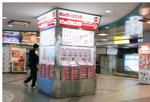
写真は【R25】の大型ラック画像になります。

L25世代の生活動線にあわせて配布ポイントを開拓しました。「通勤時」「ランチタイム」「アフターファイブ」を想定して、書店や駅、コンビニエンスストアはもちろん、彼女達の寄り道スポットであるカフェ、スクール、フィットネスクラブ、ヘアサロン、エステなどにも配布ポイントを設けます。