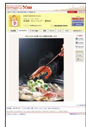
フォトギャラリー