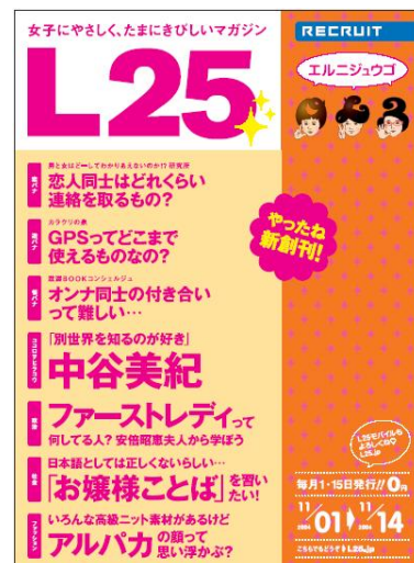
画像は『L25』創刊号表紙