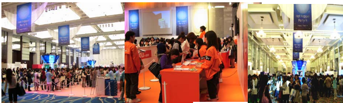
▲第8回ホットペッパーパーティーの様子

今回で9回目を迎えるホットペッパーパーティーは、協賛企業からは「1万人の流行に敏感な F 1 層に直接商品を紹介でき、会場での生の声を聞くことができる」など、また来場者からは「新商品をいち早く試すことができ、購入前にサービスを実際に体験することができる」など、好評を頂いています。