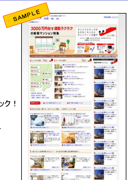
▶ キャンペーントップページ

現金10万円の当選の発表については、2008年7月中旬にメールにて行います。(当選者の銀行口座へ振込となります)。賞品の当選の発表については、賞品の発送をもって代えさせていただきます。賞品の発送は2008年7月中旬～8月下旬の予定です。