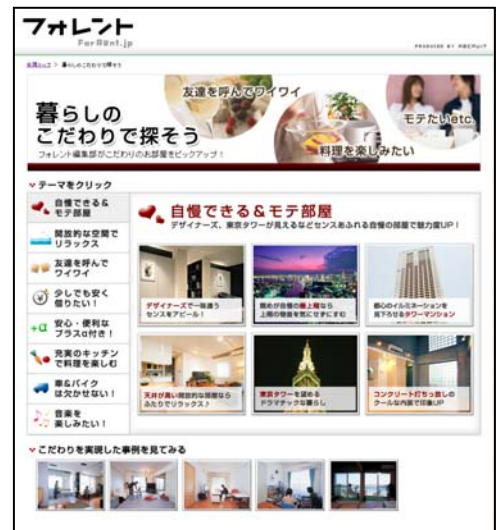
▲「暮らしのこだわりで探そう」TOPページ

リクルートではこれからも、働く、学ぶ、住む、結婚、育児、旅、車、趣味や暮らし情報など、さまざまな場面でユーザーが新しい発見・機会創出できるサービスを提供し、ひとりひとりにあった「まだ、ここにない、出会い。」を届けることを目指していきます。