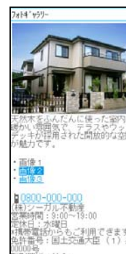
▲フォトギャラリー画面