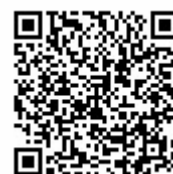
▲携帯 QR コード

リクルートではこれからも、働く、学ぶ、住む、結婚、育児、旅、車、趣味や暮らし情報など、さまざまな場面でユーザーが新しい発見・機会創出できるサービスを提供し、ひとりひとりにあった「まだ、ここにない、出会い。」を届けることを目指していきます。