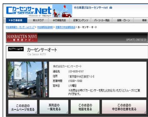
▲「販売店ナビ」イメージ画面

これまでの「販売店ナビ」に掲載されている情報だけでは伝わりにくかった販売店の雰囲気や、アフターサービスの充実度、お店で働いている人たちの様々なこだわりや魅力をピンポイントで知ること、中古車や販売店に対する不安が払拭され、安心の車選びが可能です。