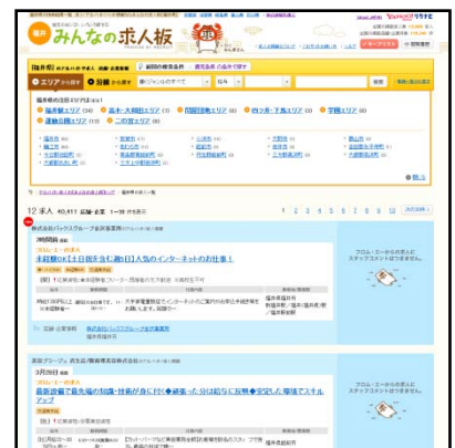
▲『みんなの求人板』TOPイメージ

今まで求人媒体に掲載されていなかった求人情報も検索できるように、求人情報は初回の利用から26週間は何度でも掲載無料としています。