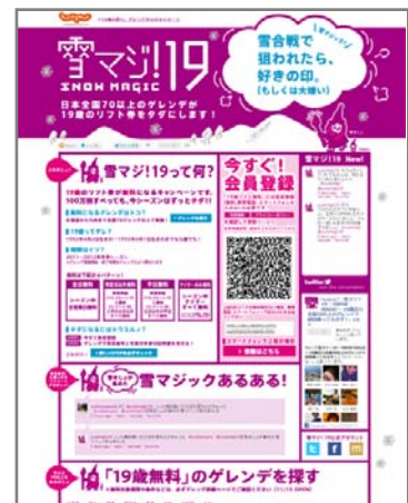
▲【公式サイト】「雪マジ！19～SNOW MAGIC～」