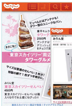
▲グルメ情報は物写真や店舗情報を紹介。スムーズに地図に飛べて、所在地も確認できる