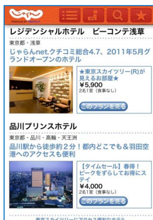
▲特集エリア周辺ホテルのお得な宿泊プランや空室情報をハイライトで紹介。ここからじゃらんnetを経由して予約ができる