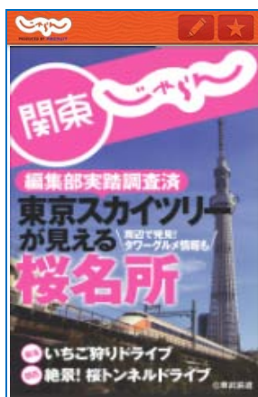
▲版別トップページ(上記は関東じゃらん)。