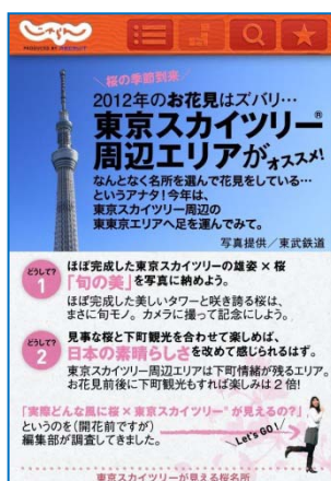
▲特集ページ。版ごとに旬のテーマで情報が取り上げられる