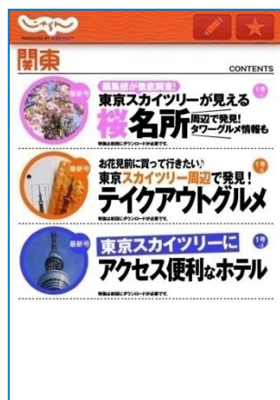
▲版別目次ページ。その号の特集が一覧表示され、それぞれ特集ページに飛べる。