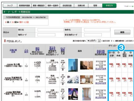
オーナーレポート利用状況画面