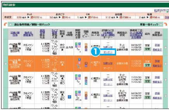
物件情報更新画面