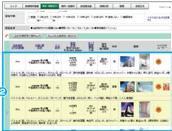
周辺物件選定画面