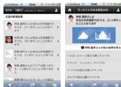
モバイルからもご利用いただけます

リクルートはこれからも、ひとりひとりにあった「まだ、ここにない、出会い。」を届けていきます。