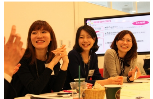
イベントで先輩ロールモデル社員の話を聞く若手女性社員

そんな「悩める28歳」の女性たちに、仕事もプライベートも両方楽しんでいく先輩社員の話を聞き、漠然とした不安を解消し、今できることに取り組んでほしい。そうした考えから、リクルートグループでは11年から28歳の女性社員向けにキャリア支援制度『Career Cafe 28』を行ってまいりました。