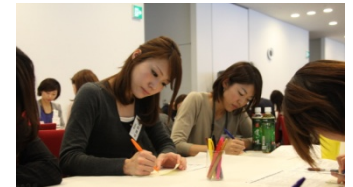
↑真剣に先輩社員の話聞く