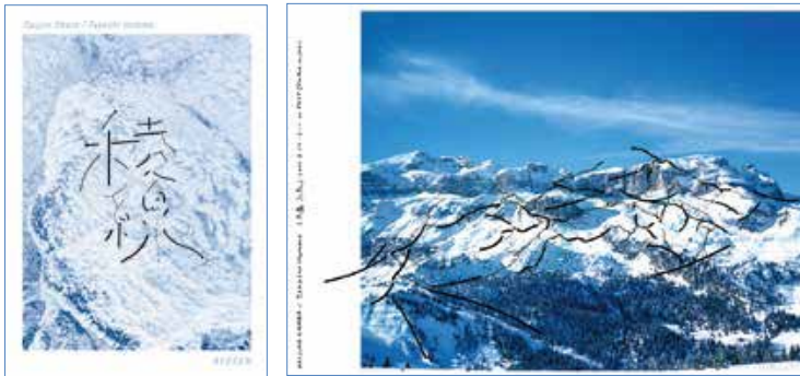
デザイナーと写真家のコラボレーション展「稜線展」のグラフィック・作品 (cl: リムアート)

1978年神奈川県生まれ。 2003年武蔵野美術大学基礎 デザイン学科卒業。同年 omomma設立。 デザインワークや映像制作に 従事するほか、展覧会、ワー クショップ、パフォーマンス などを通して、言葉や文字の 新たな知覚を探るプロジェク トを多数展開する。 2014年TDC賞受賞。