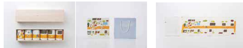
ミートソースのパッケージ 「農家のミートソース」(cl: 片山農場)