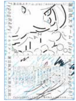
音楽家のライブ告知ポスター 「運沼執太チーム×TypogRAPy」 (cl: 運沼執太)