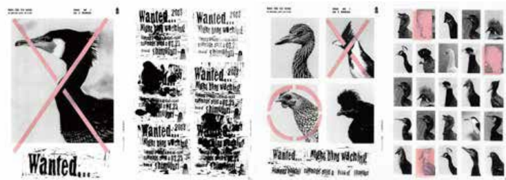
地域活性化プロジェクトのイベントポスター「ウォンテッド」(cl: ラブコトウ)