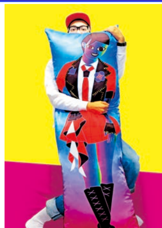
「HOLD ON あの子！」抱き枕シリーズ

今回の展覧会では、架空のアイドルをモチーフにした等身大の抱き枕10体以上のインスタレーション作品「HOLD ON あの子！」を始めとする、これまでにLEEが制作してきたアイドルをテーマとした作品を中心に発表します。大量の色彩と架空のアイドルの肖像が渦巻くLEE独自の世界観をぜひ会場でご覧ください。