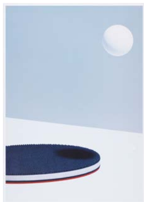
テレビ東京「世界卓球 2015」のポスター