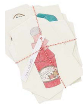
資生堂「フィリップ ワイズベッカーが描いた化粧品たち展」のグラフィックデザイン