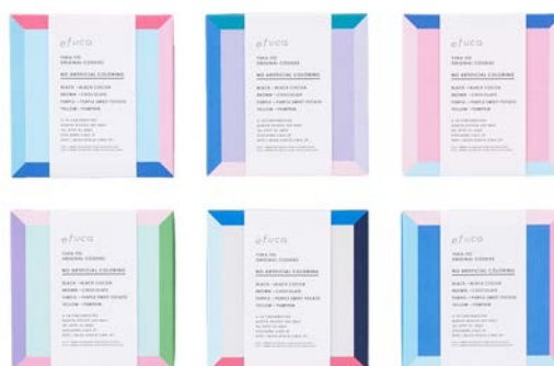
efuca. 「efuca.」のパッケージデザイン