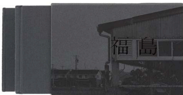
スーパーラボ「アントワン・ダガタ写真集 福島」のブック&エディトリアル