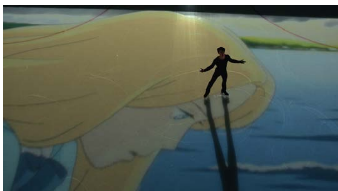
ウォルト・ディズニー・ジャパン「思い出のマーニー ジブリの涙。」のコマーシャルフィルム c 2014GNDHDDTK