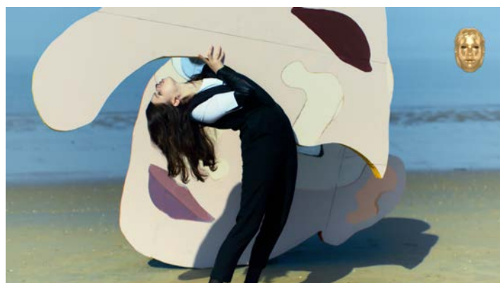
パルコ「Lily, from Solstice to Solstice.」のコマーシャルフィルム