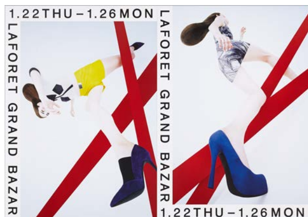
ラフォーレ原宿「LAFORET GRAND BAZAR 2015 WINTER」のポスター