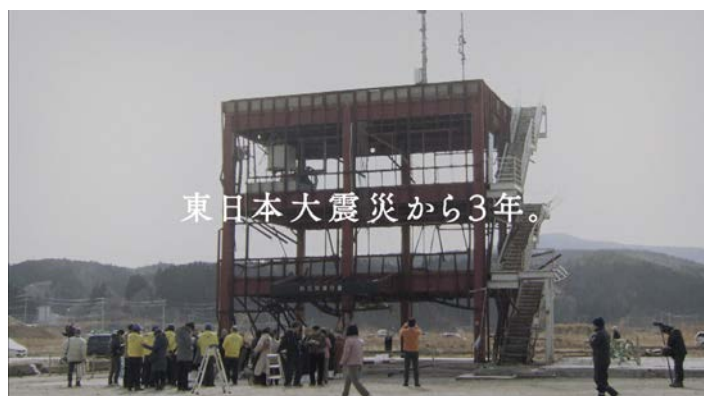
東海テレビ放送「震災から3年～伝えつづける～」のコマーシャルフィルム