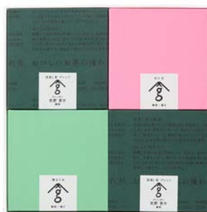
丸松製茶場「san grams」のパッケージデザイン