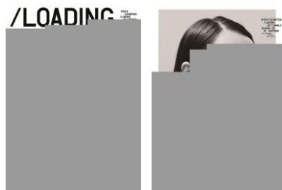
カメラマンの個展告知ポスター 「LOADING」(cl:ラップヤード)