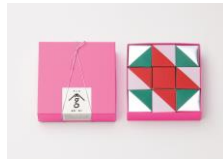
茶・菓子のパッケージ 「san grams」(cl:丸松製茶場)