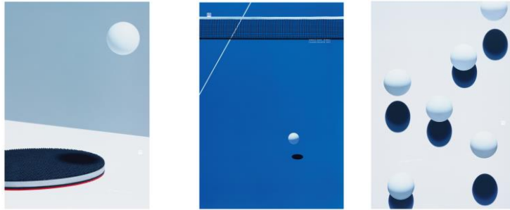
卓球世界大会のテレビ番組告知ポスター「世界卓球2015」(cl:テレビ東京)

1987年生まれ。 東京都出身。2010年多摩美術 大学グラフィックデザイン学 科卒業、同年電通入社。 主な受賞に東京ADC賞、世界 ポスタートリエンナーレトヤ マ2015銀賞、CANNES YOUNG LIONSゴールドなど 受賞。