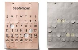
商品カレンダー 「the days」 (cl:ディー・ブロス)