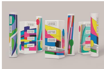
コーヒー豆のパッケージ 「THE ROASTERS AND THE STAND」 (cl:ザ・ロースターズ/ザ・スタンド)