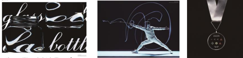
ガラス瓶の表彰事業のポスター 「glass bottle award 11th」 (cl:日本ガラスびん協会)