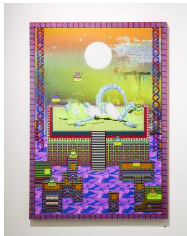
「現世再復涅槃図(上のレイヤーに結合)」 2016