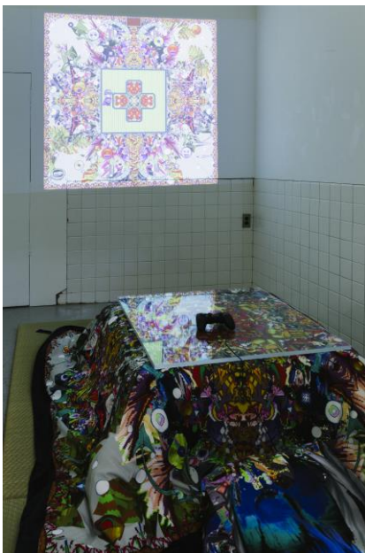
たかくらかずき×梅沢和木2人展 「社エターナル・ポータル社 輪廻M I X」 @mograg gallery 2016