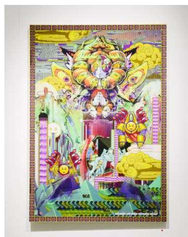
「山越天孫来迎図(下のレイヤーに結合)」 2016