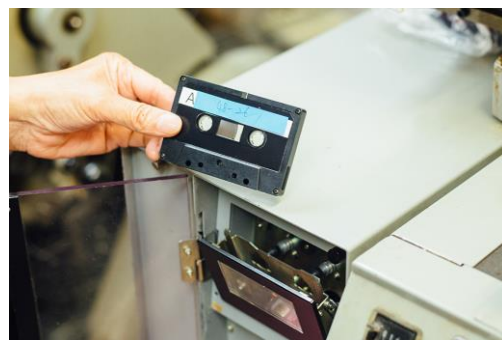
編みのデータはカセットテープに入れて