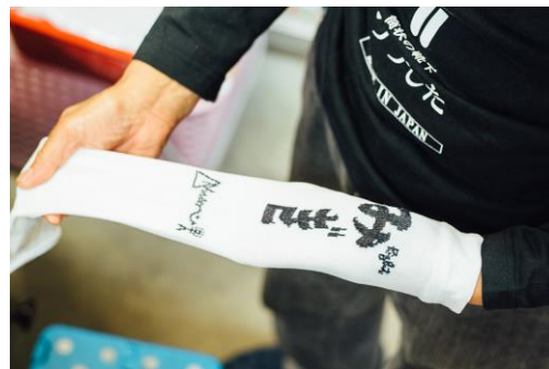
編みあがりを確認