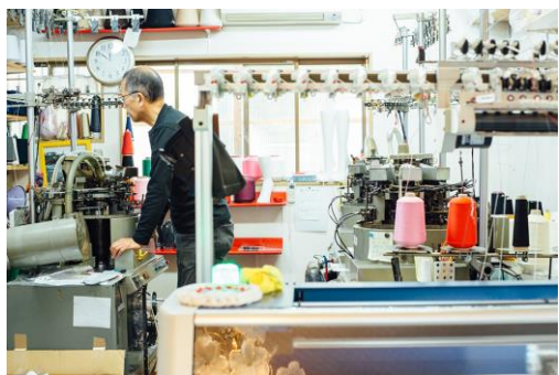
樋口メリヤス工業は、大阪府枚方市にある工房