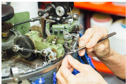
つま先とはき口を縫製して靴下の形に