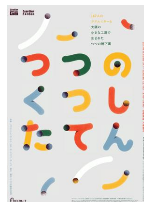
poster design:shogo kishino